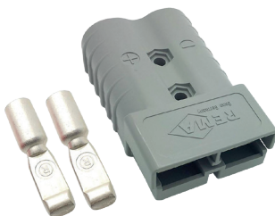
FA200767 175A | Sección 50 mm 2