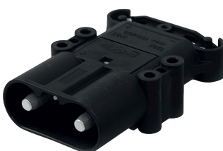
FA200764 Base porta machos Intensidad 320A