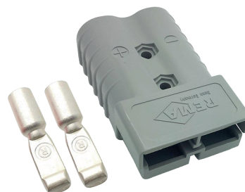
FA200768 350A | Sección 95 mm 2