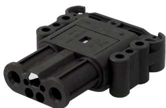
FA200760 Clavija porta hembras Intensidad 160A