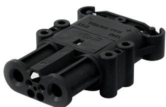
FA200763 Clavija porta hembras Intensidad 320A