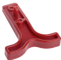
FA200769 Asa para Clavija hermafrodita 50A