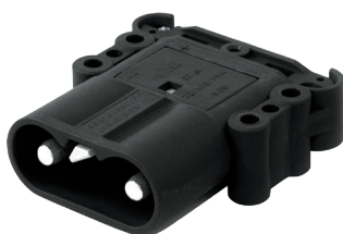
FA200761 Base porta machos Intensidad 160A