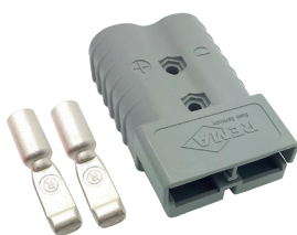
FA200766 50A | Sección 10 mm 2