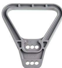
FA200770 Asa para Clavija hermafrodita 175A