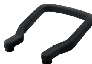
FA200765 Asa para clavija FA200763 y base FA200764